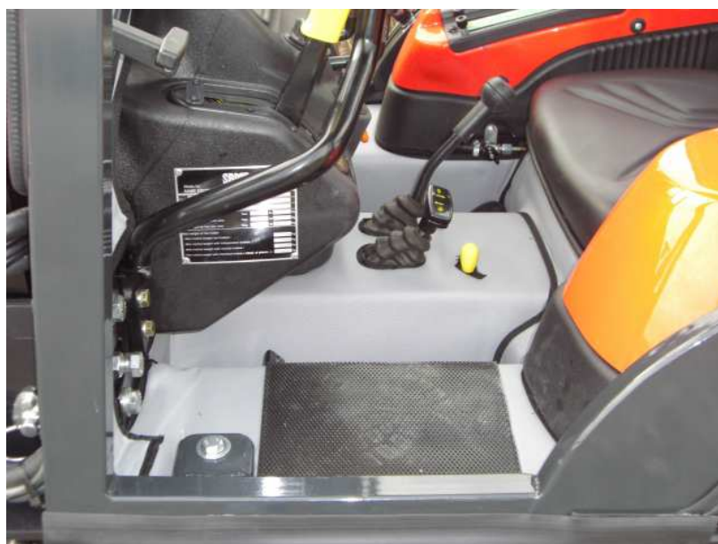
RIVESTIMENTO INTERNO FONOASSORBENTE