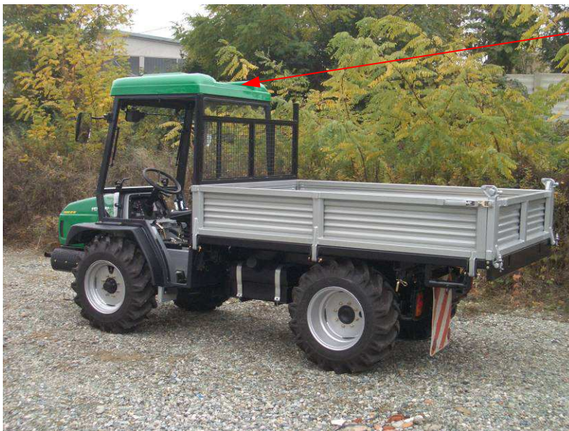
BOTOLA APRIBILE IN VETRO SU TETTO